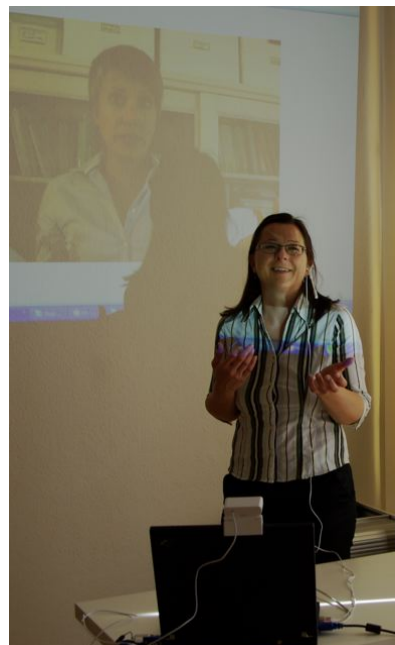
... die wir direkt per Video-Skype besprechen.