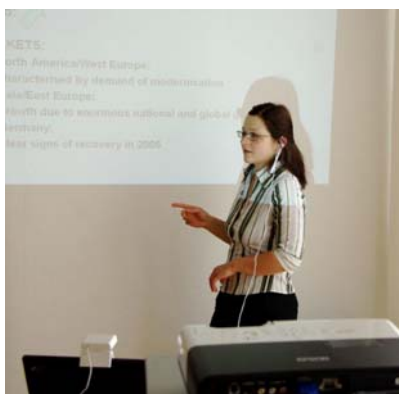
... üben Sie Ihre Präsentation ein....