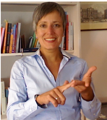
Ich mache Optimierungsvorschläge .....